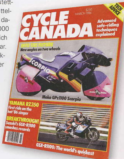
Moko Scorpio in kanadischem Magazin. Kein CH-Händler hatte wohl je soviel Publicity wie Strahm.

Dann begann die Zeit der Umbauten. «Ich hatte Mitte der 70er-Jahre eine RD 350 auffällig umgebaut und ins Schaufenster gestellt. Irgendwann kam einer rein und sagte: Wenn du mir das Teil gibst, kannst du meinen Porsche 911 da auf dem Parkplatz haben!» Strahm ging auf