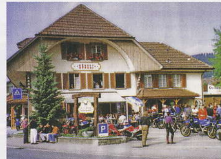
Strahms «Rössli»-Westernsaloon in Madiswil: Seit der Eröffnung 1992 wurden hier unzählige «Töffsattel-Steaks» verzehrt.

die Leidenschaft Motorrad in der heutigen Zeit? «Es ist nicht besser und nicht schlechter als früher. Nur anders. Heute hat man nicht ein, sondern fünf Hobbies, und man gibt nicht mehr alles Geld für den Töff aus. Obwohl viele Hersteller vollmundig von Individualisierung lamentieren, wird heute nur noch ab Stange umgebaut. Die Freaks, die was wirklich Eigenes bauen, sind fast ausgestorben. Aber wie gesagt, es ist eine andere Zeit. Ich habe die wirklich wilden Jahre erlebt und überlebt. Alle meine Träume sind in Erfüllung gegangen, oder ich habe sie mir selbst erfüllt.»